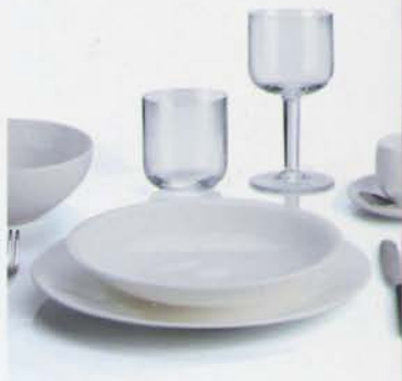
Guido Venturini, "All-time", Alessi 2012. Set per la tavola.

I minerali argillosi per lo più consistono in tetraedri di silice e ottaedri di allumina. Questa struttura è stata fonte di ispirazione per un'opera che presenta più modalità compositive nel suo essere oggetto di serie. Sono presenti 4 vassoi in plexiglas contenenti ciascuno 12 esadri; in ceramica policroma dipinta a mano, per un totale di 48 elementi (96 tetraedri accoppiati) e 192 possibilità combinatorie di colore.