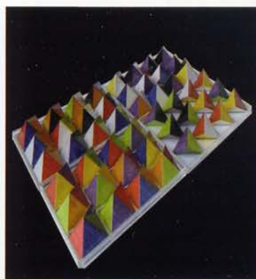
Umberto Boschi, "Cretetra" 2009.

Il ruolo poi di Tullio Mazzotti nelle "Ceramiche Giuseppe Mazzotti 1903" è stato nella ricerca: il Laboratorio sempre aperto, la sapienza e dedizione alla materia, la generosità e gratuità nella realizza-