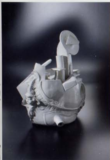
Paolo Polloniato, "Metamorfosi", 2012. Metamorfosi di una vasca modello originale 1800 Manifattura Barettoni, già Antonibon, Nove (VI); terra bianca con smalto bianco, cottura 980°, dim.: 44x37x47 cm.